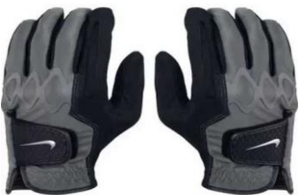
Gloves - 300 baht