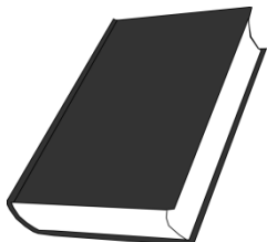
Book - 199 baht