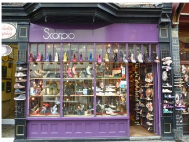
( 4 - 5 letters)