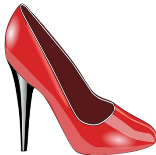
(4 - 4 letters)